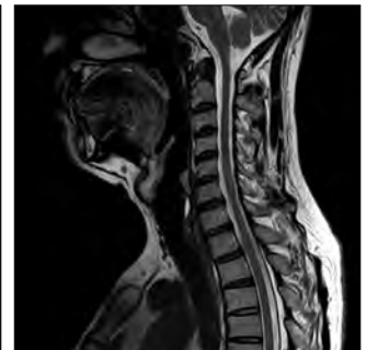
■ 頸 部