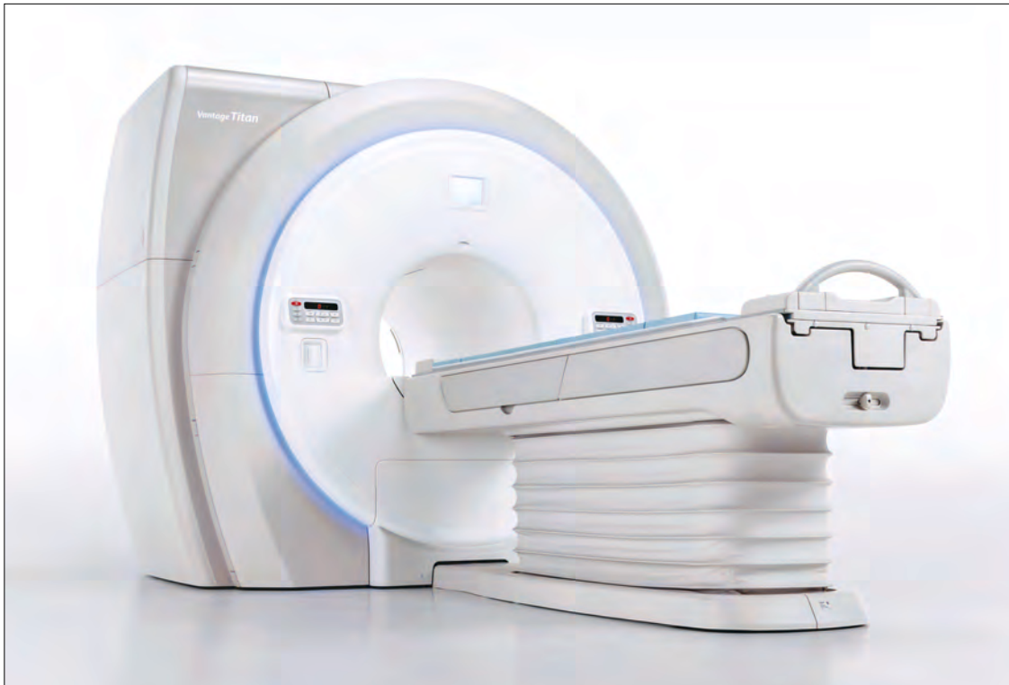
■ キヤノンメディカルシステムズ製 磁気共鳴画像診断装置

当院ではキヤノンメディカルシステムズ製1.5テスラMRI装置を導入しました。従来よりも短時間で、鮮明な画像が撮像できる高性能なMRI装置です。検査時の騒音を抑制し、検査空間が広く、優しい検査を実現した装置です。MRI装置は、磁石と電波により体の様々な部位を画像化します。放射線を使わないので、被ばくすることはありません。くわしい検査内容は、医師またはスタッフまでお気軽にお尋ねください。